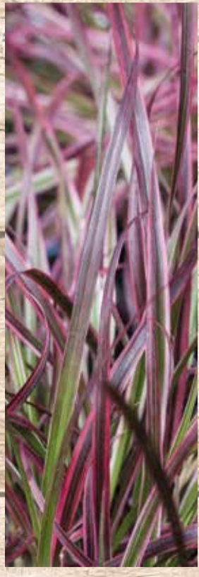
Stauden Mehrjährige Sorten, z. B. Anemonen oder Sonnenhut, die wunderschönen Herbstschmuck-Pflanzen für den Garten oder Kübel. Je Pflanze im 19 cm Topf